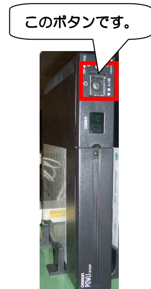
OMRON POWLI BX-50F