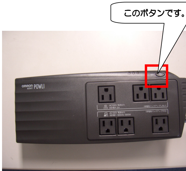
OMRON POWLI BZ-50T