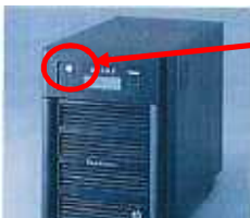
テラステーションproというのがあるが、手順は一緒